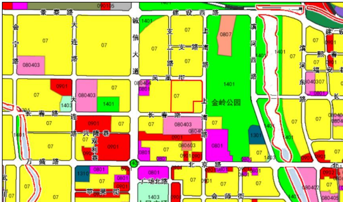
图 2 拟调整用地在国土空间规划土地使用图中的位置